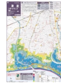
藤沢市津波ハザードマップ