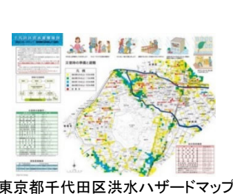
東京都千代田区洪水ハザードマップ