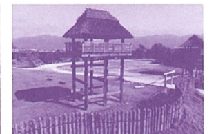
吉野ヶ里歴史公園