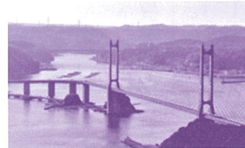
風に見える丘公園(呼子大橋の眺望)

風光明媚な唐津市鎮西町は400年前の桃山時代、全国から人と物産が集まり、諸大名たちがもたらした諸国の文化、大陸・南蛮の文化が融合して一種独特の華やかなムードと活気がみなぎっていました。そんな桃山文化のエキゾチックな「市」の様子を現在に再現した観光商業施設「道の駅桃山天下市」にてお買い物を楽しまれます。