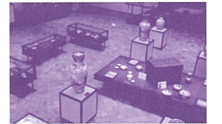
チャイナオンザパーク